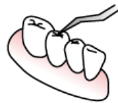
歯周ポケットの測定検査

歯周病になると歯と歯肉の間の溝(歯周ポケット)が深くなり、その中に歯石が溜まります。